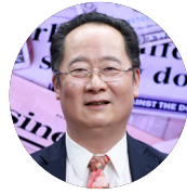
成锡忠 海外利益保护专家 西南政法大学非传统安全研究所特聘教授 北京中安华盾咨询服务有限公司常务顾问 西南民族大学国家民委东南亚研究中心特聘研究员