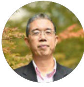
高剑波 信息安全专家 北京师范大学地理学部教授、博导 UCLA 电子信息工程博士