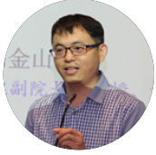
刘金山 经济安全高级研究员 暨南大学投资咨询（研究）中心主任 经济学院教授、博导 中国人民大学经济学博士