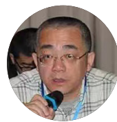
朱新光 社会安全专家 上海师范大学哲学与法政学院教授 东南亚研究中心主任 南京大学国际关系专业博士