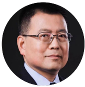
于铁军 国际安全理论专家 北京大学国际关系学院国家安全学系主任，教授 北京大学国际安全与和平研究中心主任 北京大学国际战略研究院副院长 北京大学国际政治专业博士