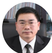
谌新民 人口安全专家 华南师范大学经管学院教授 广东省人民政府省长决策顾问专家 暨南大学经济学博士