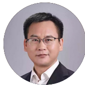
覃胜勇 公共卫生安全高级研究员 中山大学医学国际合作办公室主任 暨南大学国际关系学博士