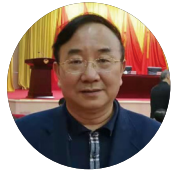
何一平 经济安全专家 广东国际经济协会原执行会长 广东省政协经济委原副主任 广东省广业集团有限公司原董事长