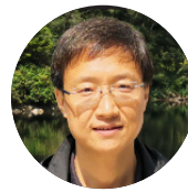
姚羽 网络安全专家 东北大学教授，博导 国家重点研发计划会评专家 国家 863 高科技计划会评专家 东北大学计算机学院博士