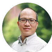
刘凤元 金融安全高级研究员 华东政法大学资本市场研究中心主任 国际金融法律学院教授