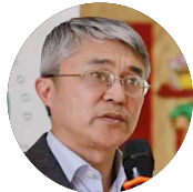
胡靖 粮食安全专家 华南师范大学教授 “三农”与城镇化研究所所长 中国人民大学经济学博士