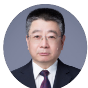
刘国柱 非传统安全理论专家 浙江大学世界史所教授、博导 浙江大学非传统安全研究中心研究员 南开大学历史学博士