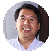
赵英 产业安全专家 中国社科院工业经济研究所原主任 中国社会科学院大学教授