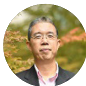
高剑波 信息安全专家 北京师范大学地理学部教授、博导 UCLA 电子信息工程博士