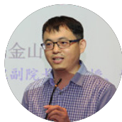
刘金山 经济安全高级研究员 暨南大学投资咨询（研究）中心主任 经济学院教授、博导 中国人民大学经济学博士