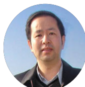
林坚 文化安全专家 人大国家发展与战略研究院研究员 社会系统工程研究中心主任 中国人民大学哲学博士