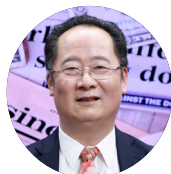
成锡忠 海外利益保护专家 西南政法大学非传统安全研究所特聘教授 北京中安华盾咨询服务有限公司常务顾问 西南民族大学国家民委东南亚研究中心特聘研究员