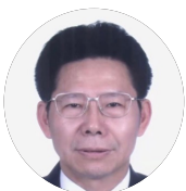
周树伟 社会安全专家 广东国际经济协会高端智库专家 广东省人民政府参事室特约研究员 广东省商务厅原副巡视员